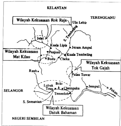
Tempat Yang Terlibat Dalam Pemberontakan Pahang

Mat Kilau, Tok Gajah, dan Datuk Bahaman telah berundur ke Kelantan dan Terengganu. Mereka menyamar sebagai orang biasa. Beberapa percubaan untuk menangkap ketiga-tiga orang pahlawan Melayu Pahang itu ternyata menemui kegagalan.