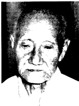
... Gambar Pahlawan Melayu Pahang, Mat Kilau yang dirakamkan pada 26 Disember 1969 dulu ...

Mereka tidak akan berganjak walau seinci pun. Biar putih tulang jangan putih mata.