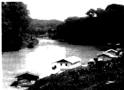
...Pangkalan lama di bandar Kuala Lipis. Pangkalan Sungai Jelai ini pada suatu ketika dahulu pernah berlaku pertempuran antara pasukan Mat Kilau dengan pihak British pada 10 April 1892 ...

Air Sungai Jelai terus mengalir tenang. Sepanjang perjalanan di pesisiran sungai itu, Mat Kilau cuma memerhatikan beberapa buah perahu Cina yang menghilir mengikut arus. Keadaan laluan sungai tidaklah begitu sibuk.